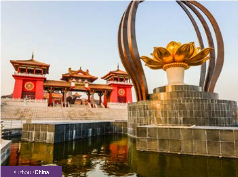
Xuzhou / China