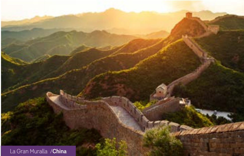
La Gran Muralla /China