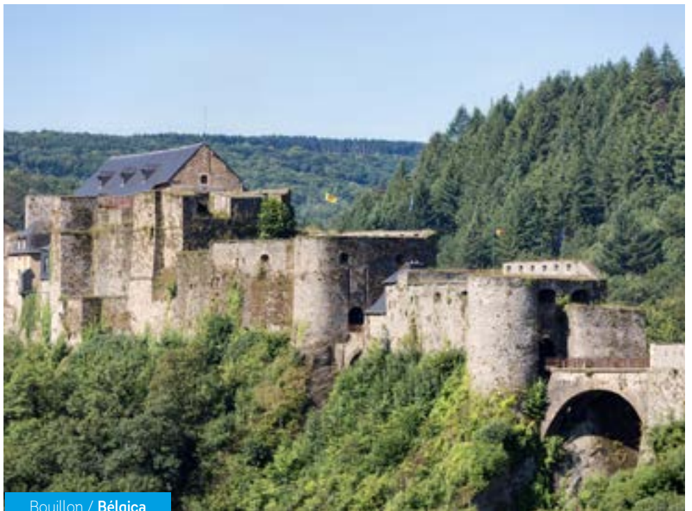
Bouillon / Bélgica