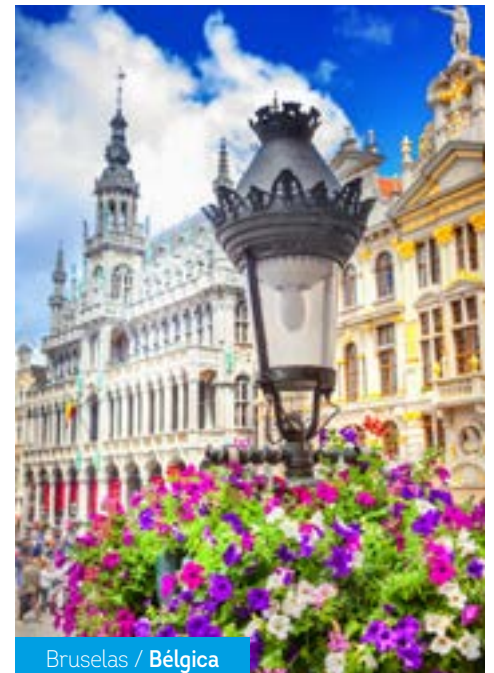
Bruselas / Bélgica