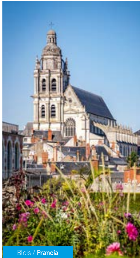
Blois / Francia